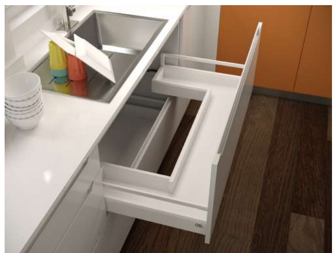
Soporte 2 Gavetas Optimus Trasera Troquelada