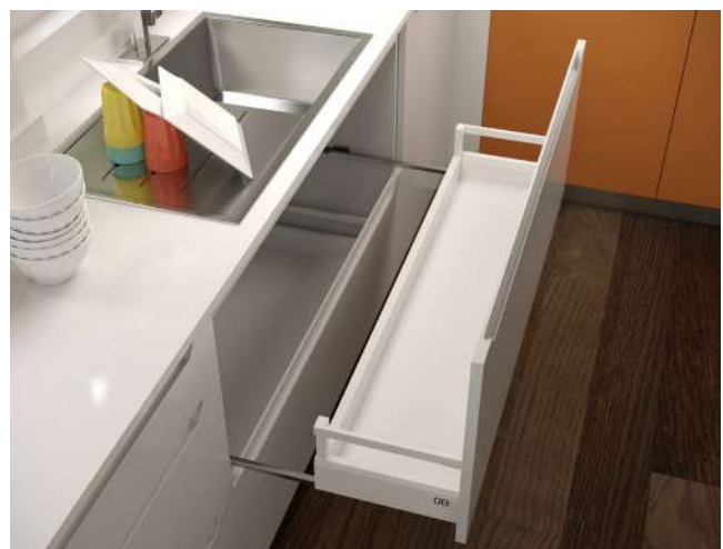
Soporte 2 Gavetas Optimus Gaveta reducida