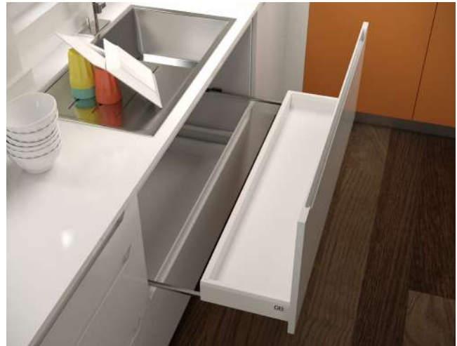
Soporte 2 Gavetas Optimus Cajón reducido

De suelo a techo, nos encontramos los armarios tipo columna, que aprovechan toda la altura de la cocina y ofrecen una gran capacidad de almacenaje y permiten crear todo tipo de combinaciones con el frigorífico o las columnas de horno y microondas.