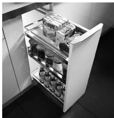
Imagen: Despensero CONFORT Bandejas