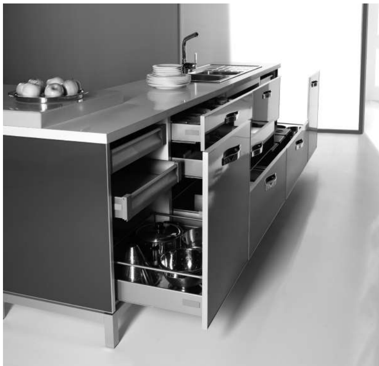
Imagen: Sistema de Cajones y Gavetas DELUXE