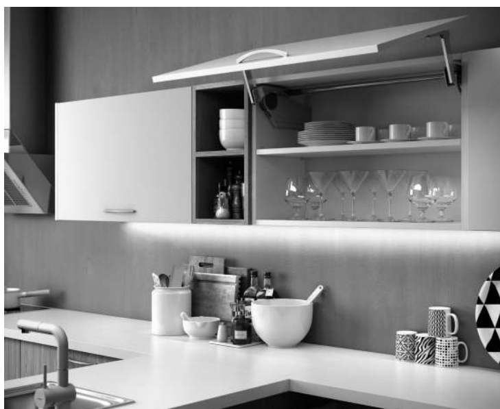
Imagen: Aventos HS (04)

Para los módulos altos también contamos con una amplia gama de compases abatibles, con soluciones de diseño y montaje para la cocina.