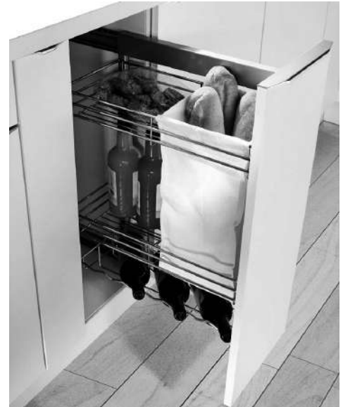
Imagen: Despensero CONFORT Panero