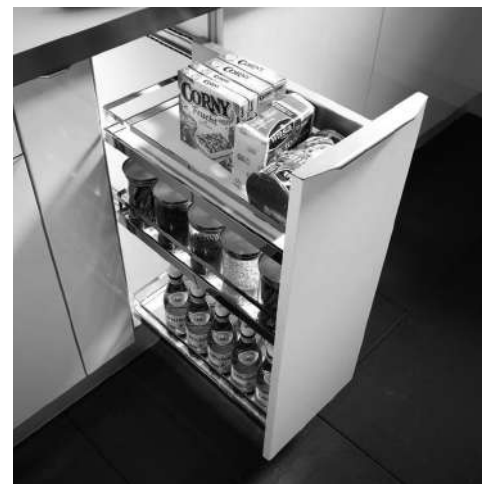
Imagen: Despensero CONFORT Bandejas

En puertas contamos con herrajes extraíbles que favorecen el acceso al módulo. Para despensa tenemos cajones y gavetas interiores, verdulero extraíble y panero extraíble, mientras que para residuos tenemos el pullboy, adaptable en capacidad a las distintas medidas de módulo.