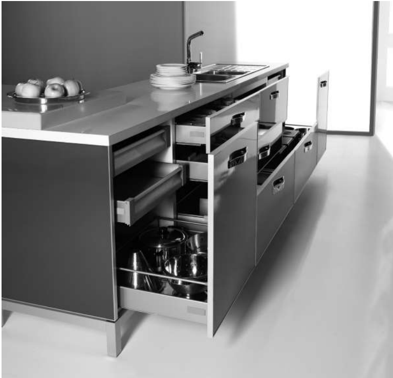
Imagen: Sistema de Cajones y Gavetas DELUXE

Laminado con acabado poro registro sincronizado